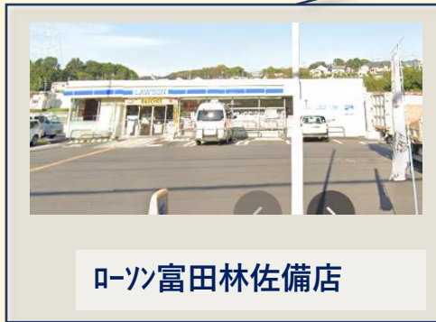
ローソン富田林佐備店