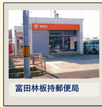
富田林板持郵便局