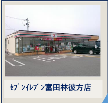
セブンイレブン富田林彼方店